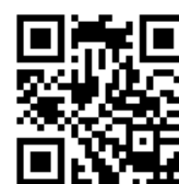
accès via navigateur