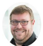
Gil PROCUREUR Lyon