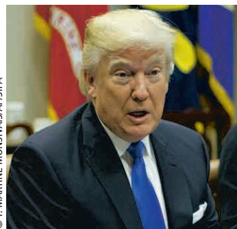
Le président va appliquer ses réformes.

Il a bien l'intention de tenir ses promesses. Cinq jours après sa prise de fonction, Donald Trump devait s'attaquer hier et aujourd'hui à la question de l'immigration. Au programme, le début des négociations en