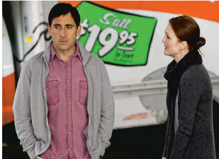
Cal Weaver (Steve Carell) et sa femme Emily (Julianne Moore) vont chacun de leur côté.

Cal Weaver tombe des nues quand sa femme lui annonce qu'elle l'a trompé avec un collègue et qu'elle souhaite divorcer. Ecoeuré par l'échec de son mariage, il se met à fréquenter un bar où il espère faire des rencontres. Mais Cal réalise que son pouvoir de séduction est proche de zéro. C'est alors qu'il est approché par un jeune et séduisant trentenaire, Jacob Palmer. Ce professionnel de la drague lui propose de l'aider à reprendre sa vie en main. Crazy, Stupid, Love est une comédie romantique qui offre à Steve Carell, l'acteur révélé par la série The Office (version américaine), un rôle à la mesure de son talent comique. Plus sexy que jamais, Ryan Gosling est irrésistible en dragueur invétéré. Avec aussi Julianne Moore et Emma Stone. • Crazy, Stupid, Love , HD1, 20h55.