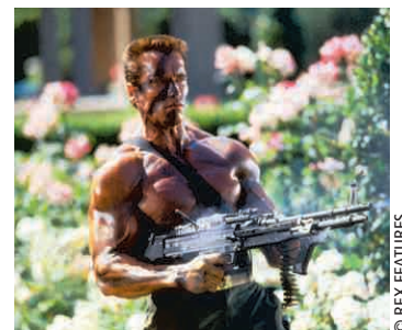
Schwarzenegger va se fâcher tout rouge.

Ex-membre d'un commando d'élite , John Matrix aspire au calme avec sa fille, Jenny. Sa retraite prend fin quand le capitaine Bennet, ancien camarade déchu de son unité, kidnappe sa fille. S'il souhaite la revoir, il doit aider un dictateur à faire un coup d'Etat. John se lance dans un périple sanglant pour la sauver. En 1985, les muscles de Schwarzenegger luisaient dans Commando , un film au scénario familial, mais efficace. • Commando , NRJ12, 22h45.