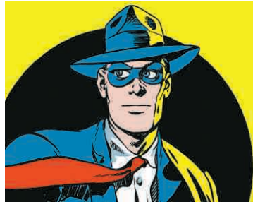
Les héros vintage et leurs auteurs sont plus que jamais à l'honneur de cette 44 e édition.