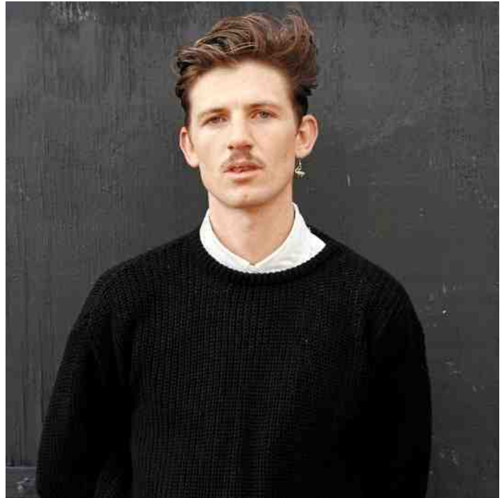
Romare est Anglais, mais c'est de la culture africaine qu'il s'inspire.

« Écoutez-les donc, ces enfants de la nuit. N'est-ce pas la plus belle des musiques... ? », interrogeait le comte Dracula, de Bram Stoker. Influencé équitablement par Daniel