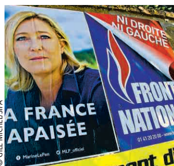
Les électeurs viennent de tous horizons.

Avec en moyenne 30 % d'intentions de vote à chaque élection, le Front national est ancré dans le jeu politique. Avec La tentation FN , Olivier Toscer a voulu décrire qui étaient ces quelque sept millions