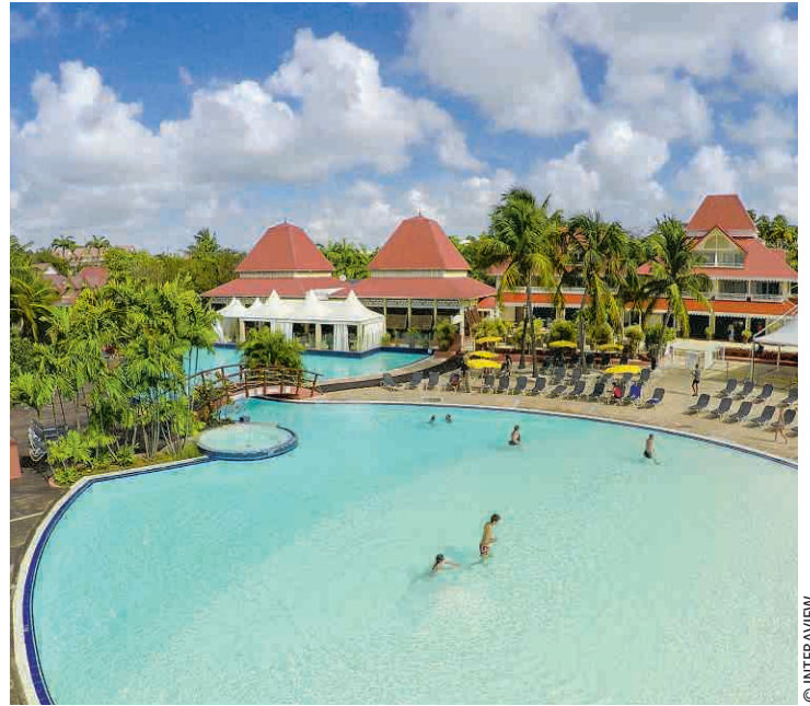
La Guadeloupe (ici, le village Sainte-Anne) fait partie des destinations proposées.

L'offre inclut l'hébergement, les vols et les transferts.