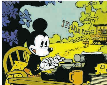
© J.-C. MEZIERES/DARGAUD - W. EISNER - FRANQUIN - COSEY/GLÉNAT

mettront en relief le caractère unique de son héros dégingandé et gaffeur, créé par Franquin en 1957. Les thèmes de prédilection (pacifisme, écologie...) de ce monstre sacré, disparu il y a vingt ans, seront aussi mis en valeur.