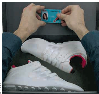
Une carte de réductions et des baskets.

Hop ! Air France mise sur l'originalité pour promouvoir sa carte destinée aux 12-24 ans inaugurée en avril dernier. La compagnie aérienne lancera en effet, dès demain et jusqu'à samedi, sur son corner installé au Cita-