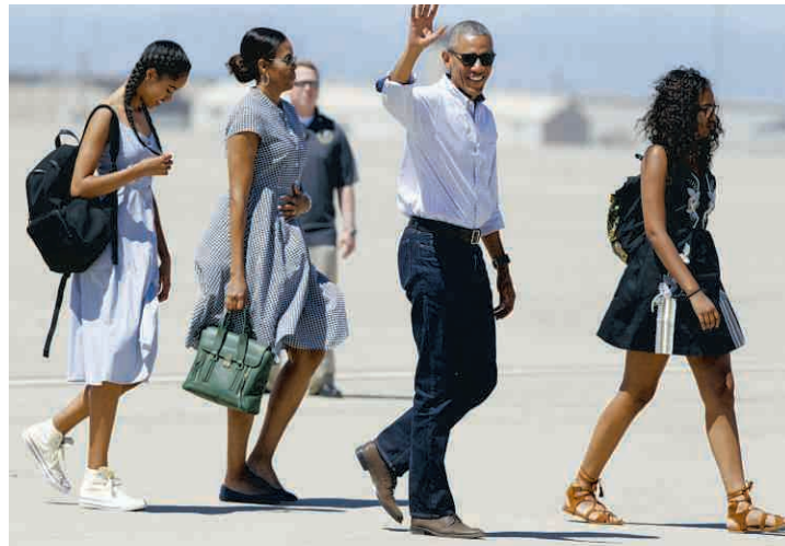
Obama souhaite accompagner sa fille Sasha (à droite) jusqu'à la fin de sa scolarité.

Contrairement à ses prédécesseurs, qui se sont empressés de fuir Washington une fois leurs mandats terminés, Barack Obama a décidé de rester dans la capitale fédérale jusqu'à ce que sa fille Sasha ait fini sa scolarité. Il pourrait mettre cette période à profit pour rédiger ses mémoires, ayant déjà signé un contrat avec la maison d'édition Random House, qui avait publié ses premiers ouvrages. Avant de devenir président, il avait écrit un manifeste politique, un livre pour